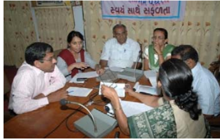
Participants are busy in Expressing & Exchanging their Views